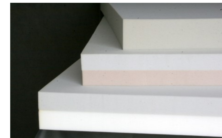
Unterschiedliche Kernauführungen. Bezüge nach Wahl.