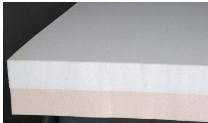
Modell 2-schichtige Schaummatratze. Hier Kern ohne Bezug.