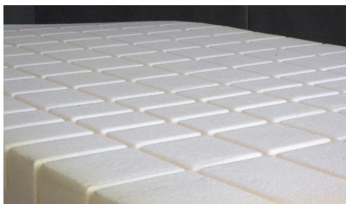
Modell Würfelmatratze Kaltschaum: Hier Kern ohne Bezug.