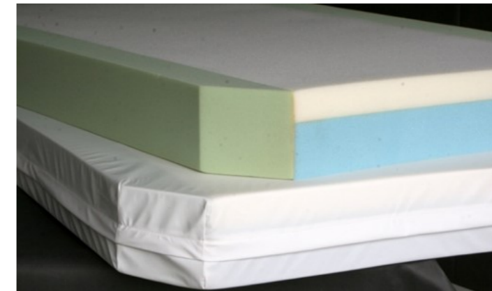
Modell 2-schichtige Weichlagerungsmatratze mit fester Sitzkante. Hier mit Bezug in PU-beschichtetem Polyestertextil mit verdecktem Reißverschluss (Inkontinenzbezug).

markosan|® ist ein Markenprodukt aus unserem Hause. Es unterliegt grundsätzlich unseren strengen Anforderungen und Kontrollen. Von uns werden nur ausgesuchte hochwertige Materialien verarbeitet, die unserem hohen Qualitätsstandard entsprechen.