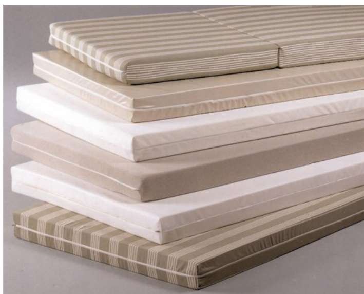
Modell 1-schichtige Polyätherschaum- oder Kaltschaummatratze: Hier mit diversen Matratzenbezügen.