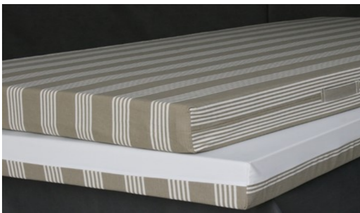
Modell Universal-Krankenhaus-Matratze: Hier mit Bezug in sanforisiertem Streifendrell und Wendeb Bezug PU/sanf. Streifendrell.